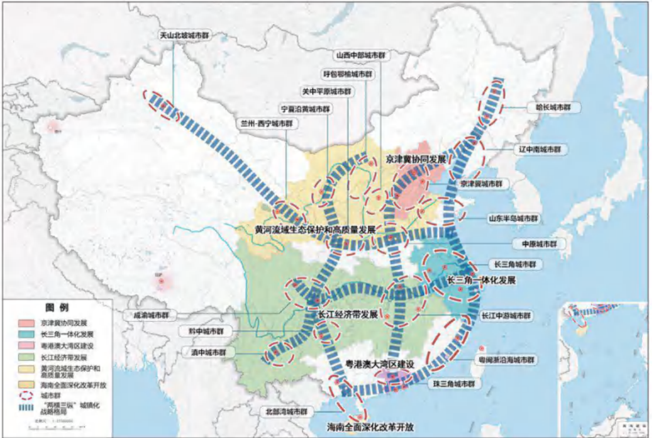
图3 城镇化空间格局示意图