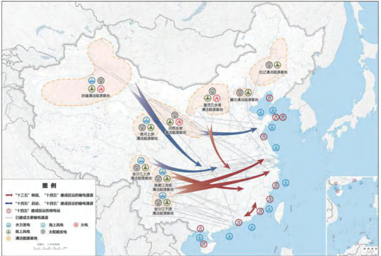
图1 “十四五”大型清洁能源基地布局示意图