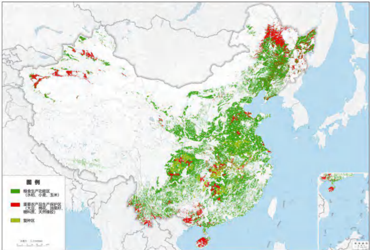
图 2 粮食生产功能区和重要农产品生产保护区布局示意图