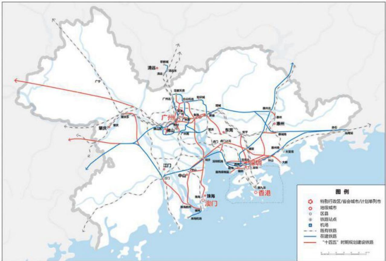
图 5 粤港澳大湾区轨道交通规划图

加强粤港澳产学研协同发展，完善广深港、广珠澳科技创新走廊和深港河套、粤澳横琴科技创新极点“两廊两点”架构体系，推进综合性国家科学中心建设，便利创新要素跨境流动。加快城际铁路建设，统筹港口和机场功能布局，优化航运和航空资源配置。深化通关模式改革，促进人员、货物、车辆便捷高效流动。扩大内地与港澳专业资格互认范围，深入推进重点领域规则衔接、机制对接。便利港澳青年到大湾区内地城市就学就业创业，打造粤港澳青少年交流精品品牌。