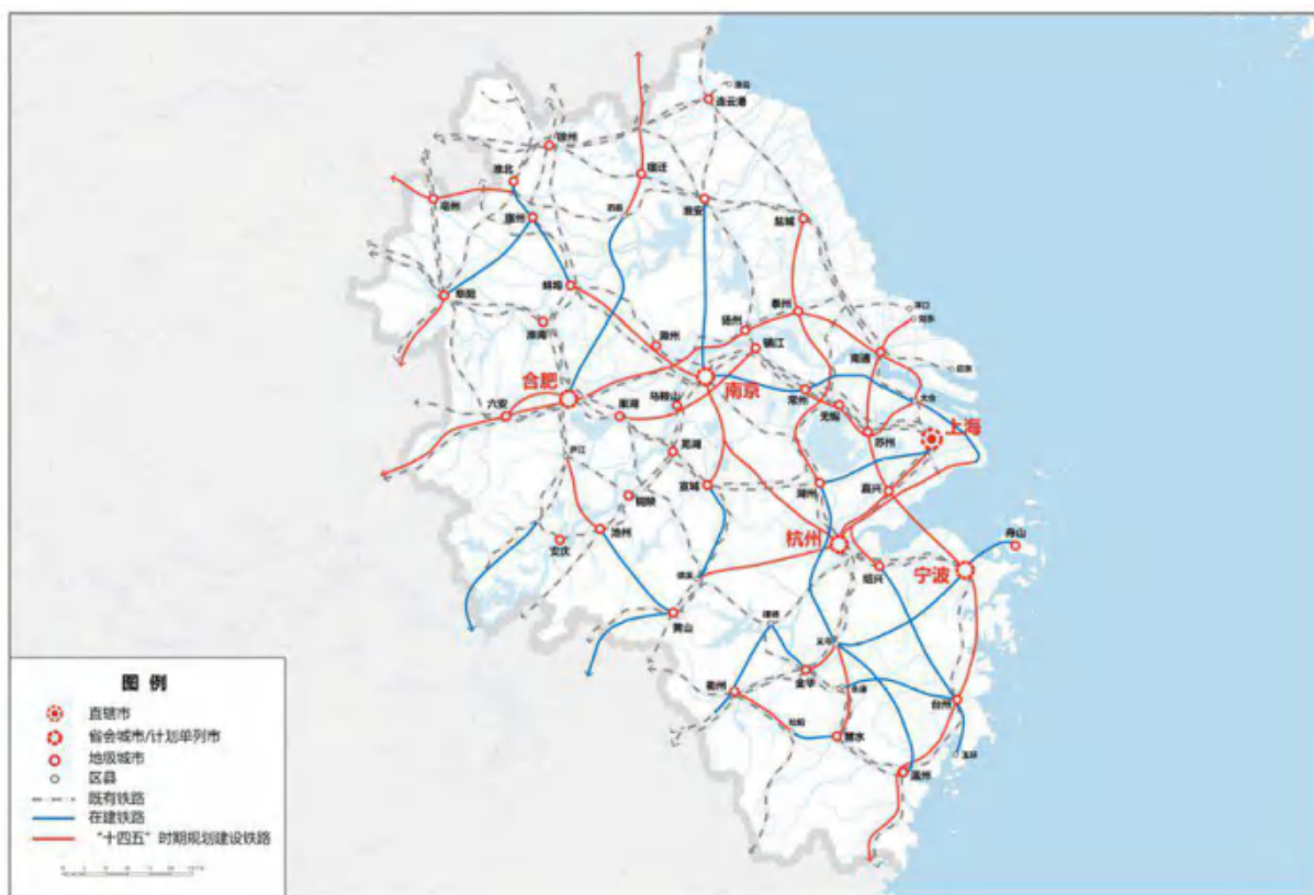
图 6 长三角地区轨道交通规划图

瞄准国际先进科创能力和产业体系，加快建设长三角 G60 科创走廊和沿沪宁产业创新带，提高长三角地区配置全球资源能力和辐射带动全国发展能力。加快基础设施互联互通，实现长三角地级及以上城市高铁全覆盖，推进港口群一体化治理。打造虹桥国际开放枢纽，强化上海自贸试验区临港新片区开放型经济集聚功能，深化沪苏浙皖自贸试验区联动发展。加快公共服务便利共享，优化优质教育和医疗卫生资源布局。推进生态环境共保联治，高水平建设长三角生态绿色一体化发展示范区。